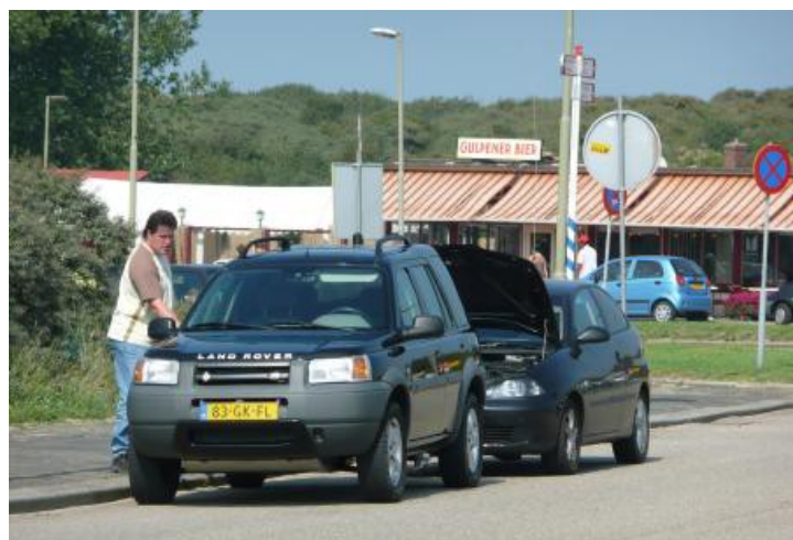
Atc-ers met pech? Nee hoor! Even kletsen met een drankje!